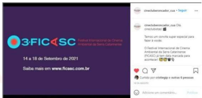
CINECLUBE RONCADOR/MÍDIAS SOCIAIS | 19 AGO