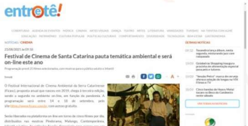
ENTRETÊ | 23 AGO