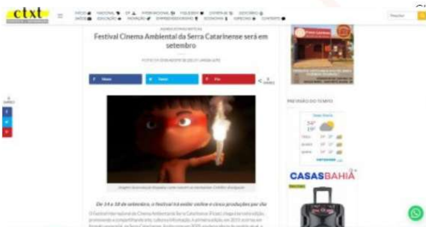
PORTAL CONTEXTO | 20 AGO