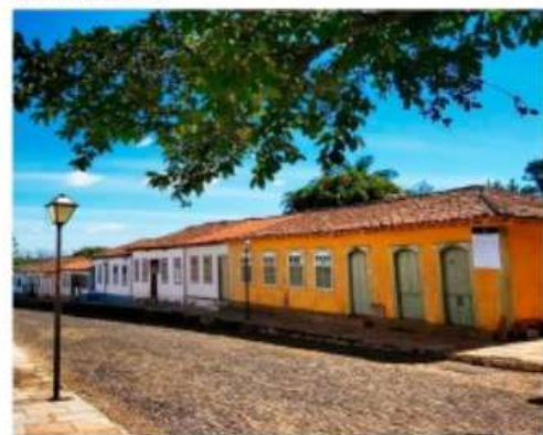
Filme gravado em Pirenópolis, chamado Rio das Águas e Fogos Memórias, participa do Festival Internacional de Cinema Ambiental da Serra Catarinense (FICASC), que acontece entre os dias 14 e 18 de setembro.